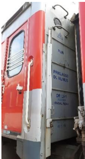
4 nuotrauka. Kėbulo priekis (kopėtėlės), kairė