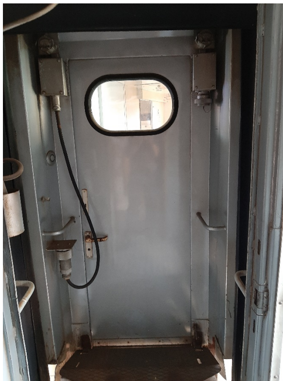
3 nuotrauka. Vagono galinės durys (2 lentelės 4 eilutė)