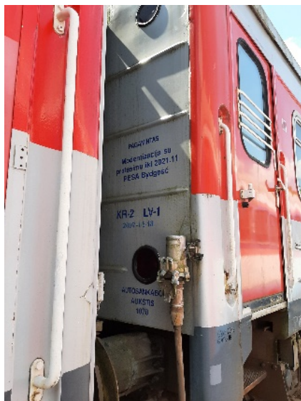
5 nuotrauka. Kėbulo priekis, dešinė