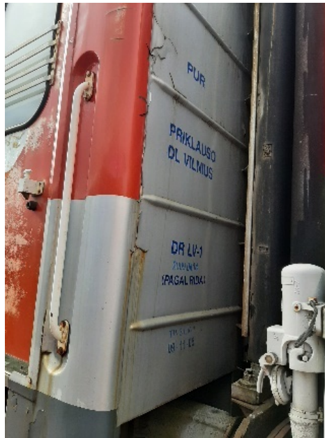
7 nuotrauka. Kėbulo galas, kairė