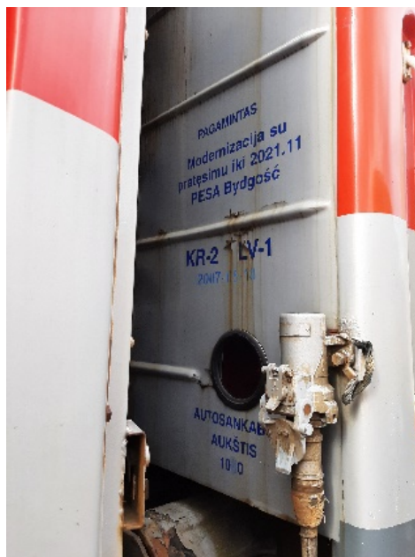
6 nuotrauka. Kėbulo galas, dešinė