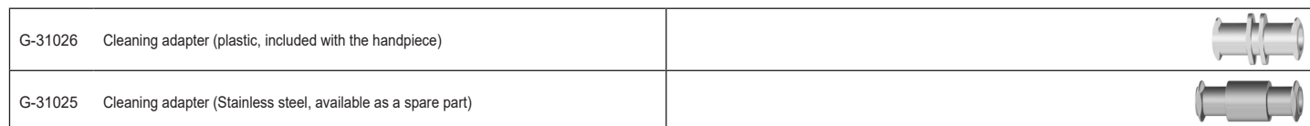
Tab. 1: Accessories, illustrations not to scale