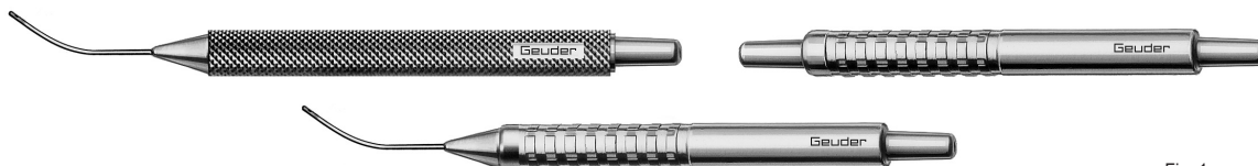
Fig. 1: example illustrations, not to scale

These product related processing instructions for critical* medical devices (MD) are exclusively valid for the above listed items by GEUDER AG. All medical devices that are provided in a non-sterile way must be reprocessed before each application.