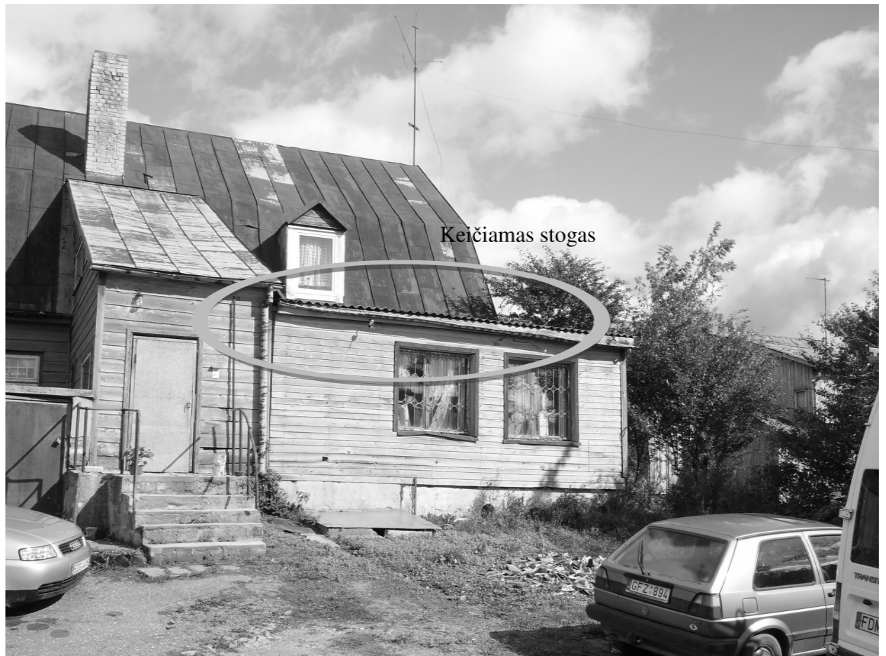
1 paveikslas. Pašto nuotraukos.