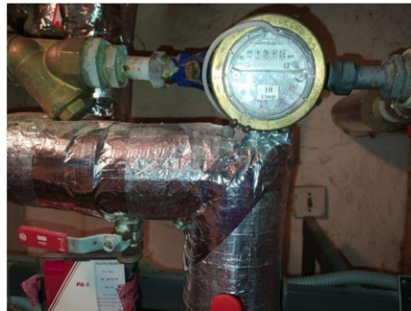
pav. 8 VS1.3 Sumontuota papildoma įranga ant esamo skaitiklio

Esant poreikiui užsakovas gali pateikti turimų kontrolinių skaitiklių foto nuotraukas/prieigą prie archyvo.