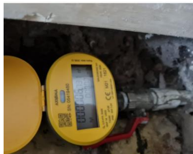
pav. 6 VS2.1 Pakeisto vandens skaitiklio vizualizacija

Žemiau pateikiama tipinė keitimo vizualizacija. Esamas skaitiklis pakeičiamas nauju skaitikliu.