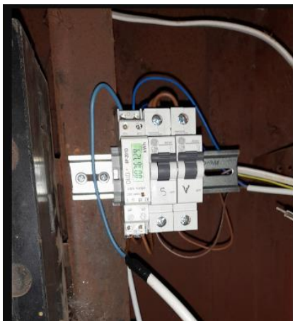
pav. 2 1F esamas elektros skaitiklis

Žemiau pateikiama tipinė 1 fazės skaitiklio keitimo vizualizacija. Esamas skaitiklis pakeičiamas nauju skaitikliu.