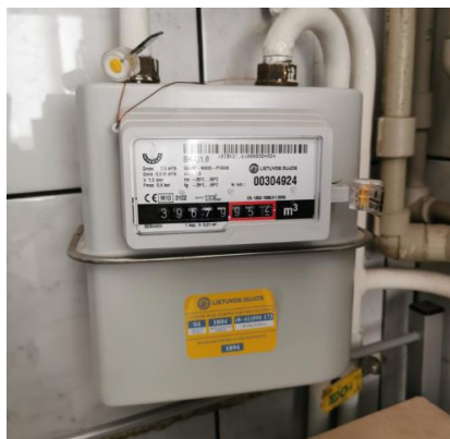
pav. 7 DS1.2 Esamo dujų skaitiklio vizualizacija

Rangovas kartu su impulsų keitikliais privalo pateikti ir impulsų keitiklių konfigūravimo programinę įrangą. Rangovas privalo atlikti impulsų modulio ir Mbus/Impulsų keitiklių montavimo ir konfigūravimo darbus.