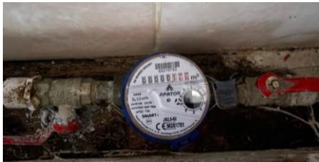
pav. 9 VS1.4 Esamo skaitiklio vizualizacija

Žemiau pateikiama tipinė esamo vandens skaitiklio vizualizacija. Esamas skaitiklis paliekamas, sumontuojamas papildomas Mbus nuskaitymo modulis.