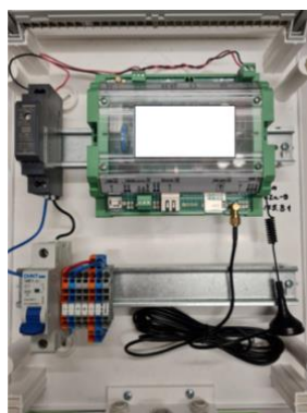
pav. 8 DK1.1 Tipinis pagrindinio duomenų kaupiklio skydelis

Elektros maitinimas duomenų kaupikliui numatomas iš artimiausio elektros paskirstymo skydelio. ANS duomenų kaupiklio elektros maitinimas turi būti atliekamas naudojant atskira automatinį jungiklį, kurį turi įrengti ANS sistemos rangovas.