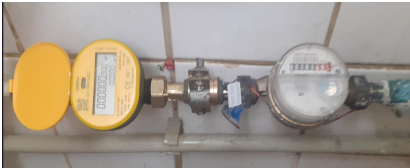
pav. 6 VS1.2 Esamo skaitiklio ir papildomo skaitiklio vizualizacija

Žemiau pateikiama tipinė esamo vandens skaitiklio vizualizacija. Esamas skaitiklis paliekamas, sumontuojamas papildomas vandens skaitiklis.