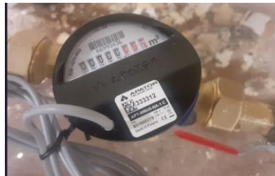
pav. 10 VS1.4 Sumontuotas papildomas Mbus modulis ant esamo skaitiklio

Esant poreikiui užsakovas gali pateikti turimų kontrolinių skaitiklių foto nuotraukas/prieigą prie archyvo.