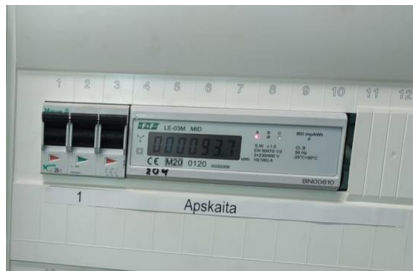
pav. 4 3F pakeistas elektros skaitiklis

Žemiau pateikiama tipinė 3 fazių skaitiklio keitimo vizualizacija. Esamas skaitiklis pakeičiamas nauju skaitikliu.