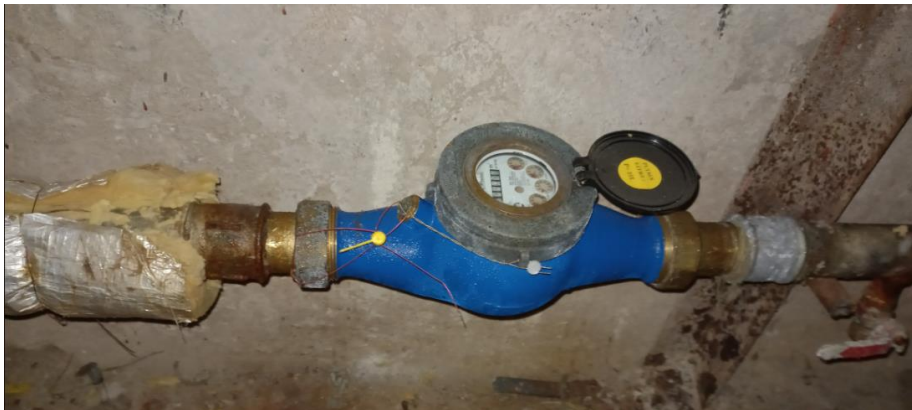
pav. 5 VS1.1 esamo vandens skaitiklio vizualizacija

Žemiau pateikiama tipinė esamo vandens skaitiklio vizualizacija. Esamas skaitiklis pakeičiamas nauju skaitikliu.