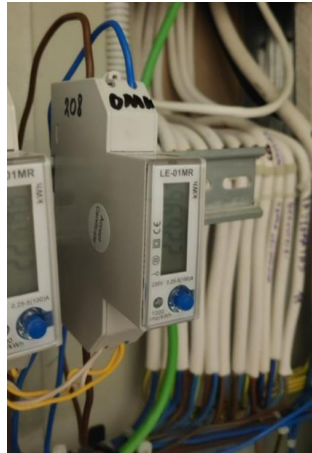
pav. 1 1F pakeistas elektros skaitiklis

Esant poreikiui užsakovas gali pateikti turimų kontrolinių skaitiklių foto nuotraukas/prieigą prie archyvo.