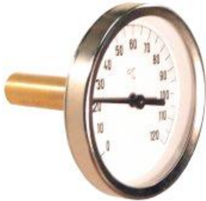
T 63/50 termometras